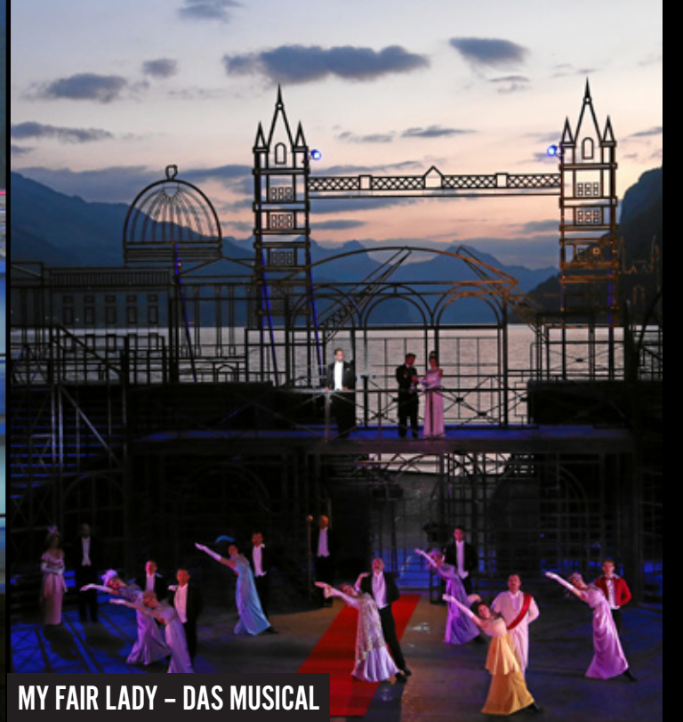
MY FAIR LADY – DAS MUSICAL