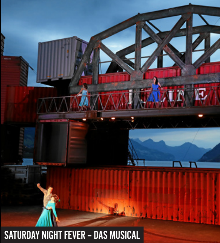
SATURDAY NIGHT FEVER – DAS MUSICAL