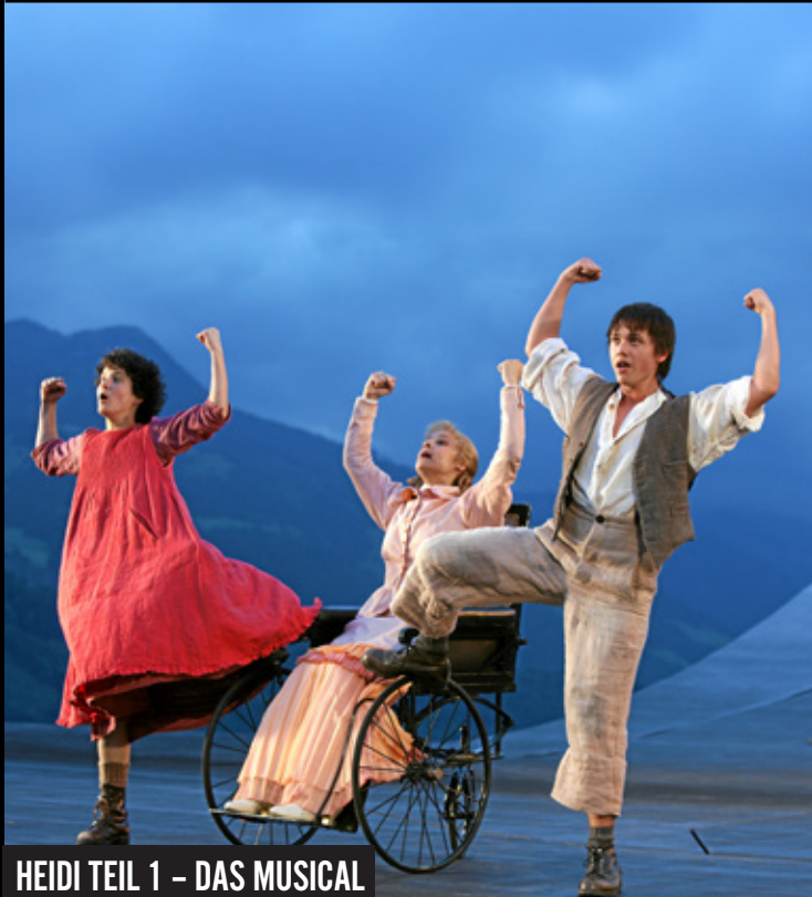
HEIDI TEIL 1 – DAS MUSICAL