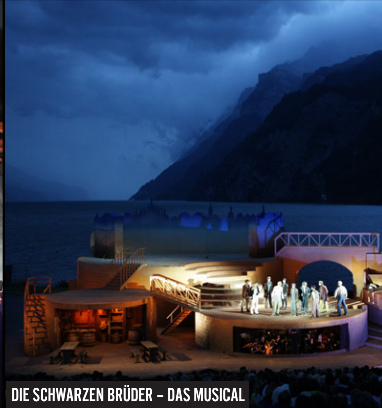
DIE SCHWARZEN BRÜDER – DAS MUSICAL