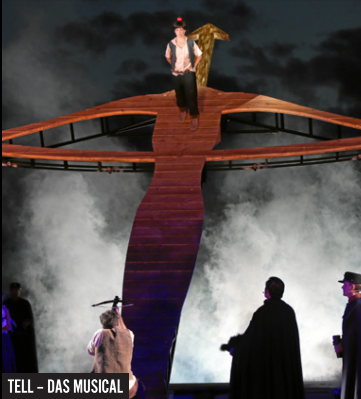
TELL – DAS MUSICAL