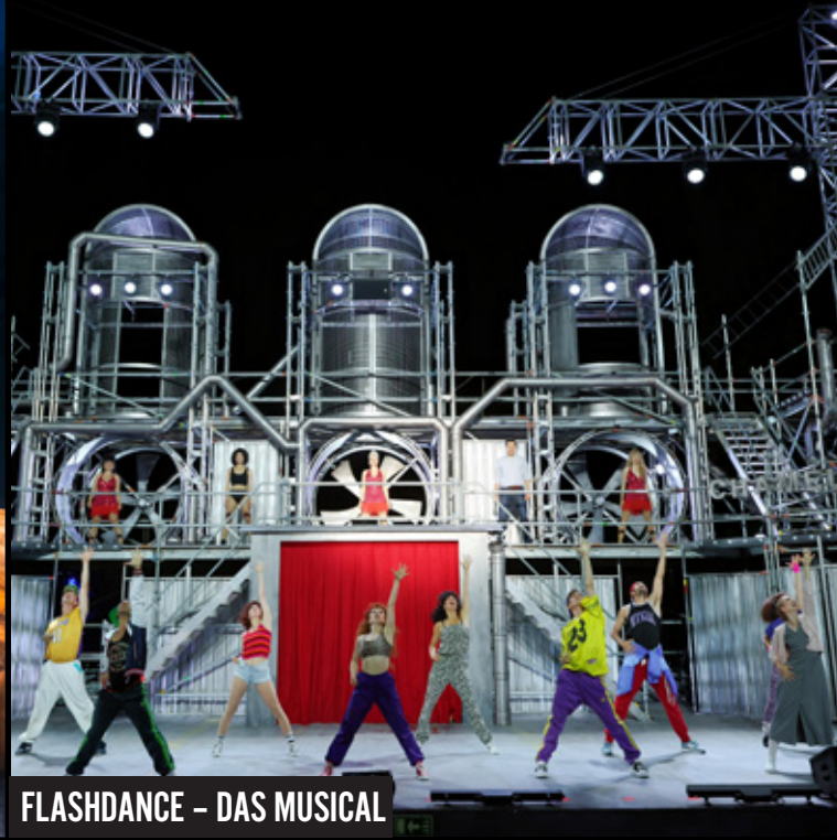
FLASHDANCE – DAS MUSICAL