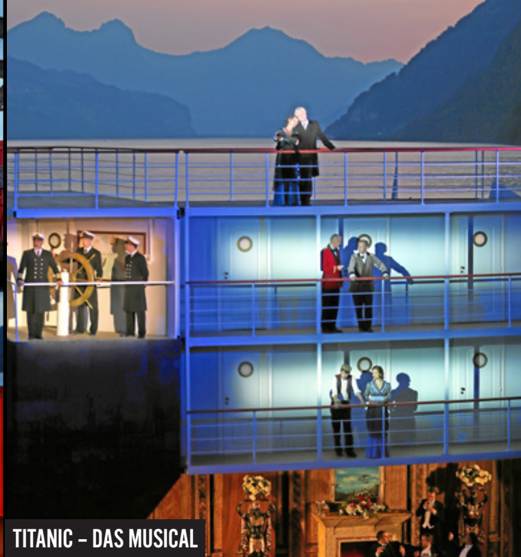
TITANIC – DAS MUSICAL