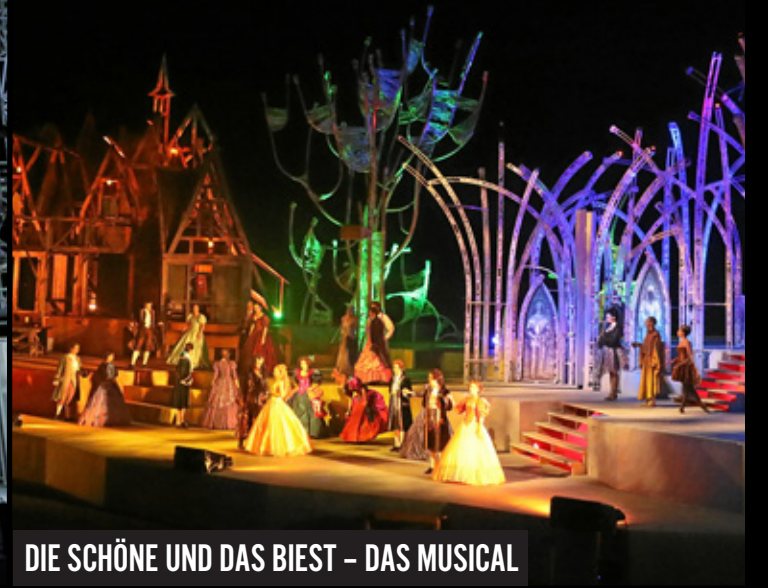
DIE SCHÖNE UND DAS BIEST – DAS MUSICAL