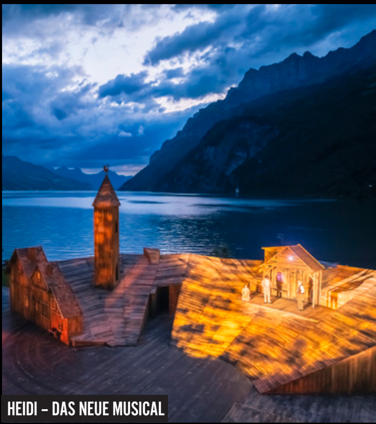
HEIDI – DAS NEUE MUSICAL