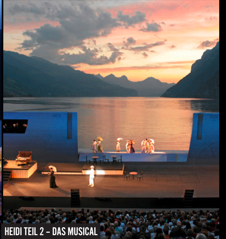
HEIDI TEIL 2 – DAS MUSICAL